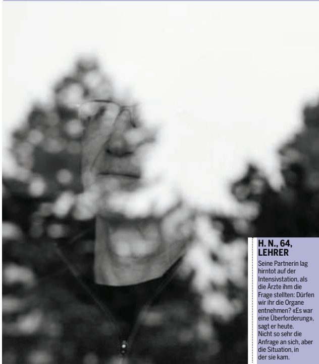
H. N., 64, LEHRER

Seine Partnerin lag hirntot auf der Intensivstation, als die Ärzte ihm die Frage stellten: Dürfen wir ihr die Organe entnehmen? «Es war eine Überforderung», sagt er heute. Nicht so sehr die Anfrage an sich, aber die Situation, in der sie kam.